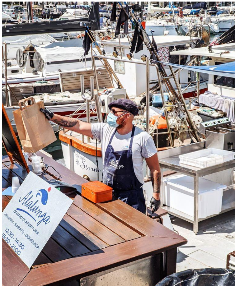
Alalunga pesca of Savona Cooperative