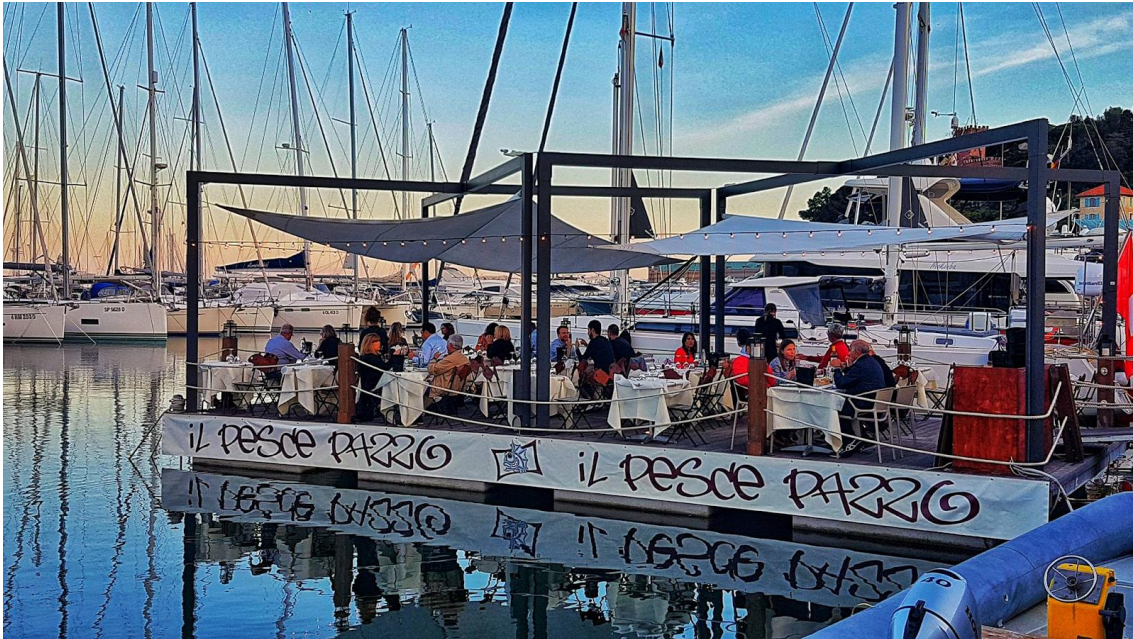
Crazy Fish Cooperative of Varazze- Liguria