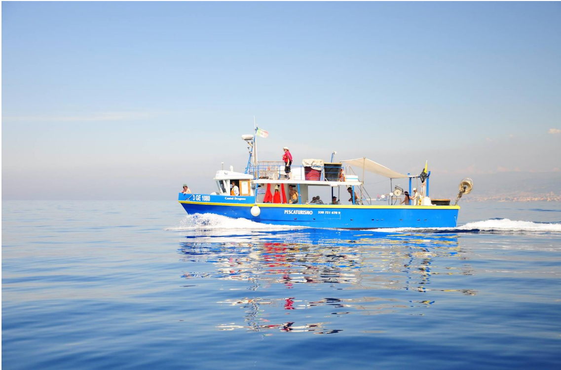
Castel Dragone - Camogli (Ge) - Liguria